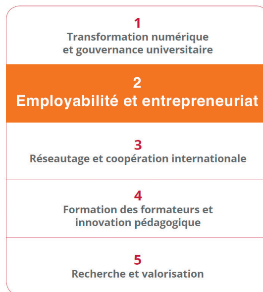
Les 5 axes de la stratégie de l'AUF 2021-2025

Les Centres d'Employabilité Francophones (CEF) constituent, avec le déploiement et l'extension du programme « Étudiant-Entrepreneur », le projet majeur de l'axe 2 de la stratégie de l'AUF pour 2021-2025 qui concerne l'employabilité et l'entrepreneuriat des étudiants .