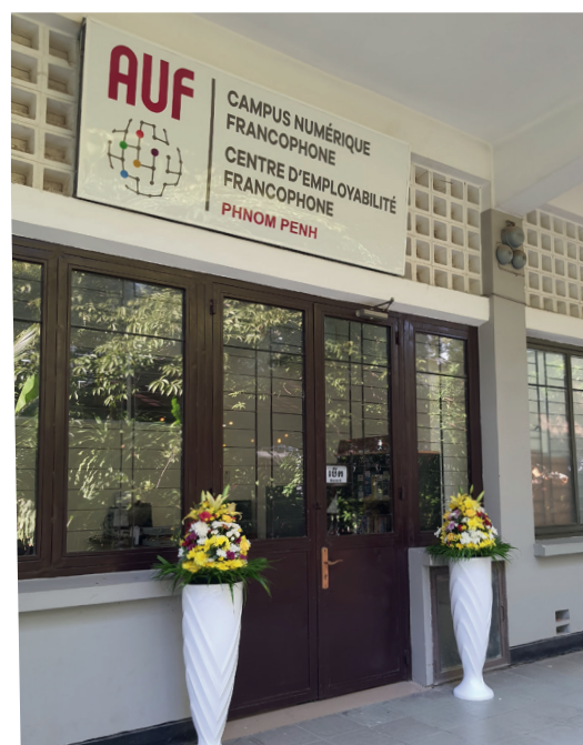
CEF Phnom Penh, Cambodge