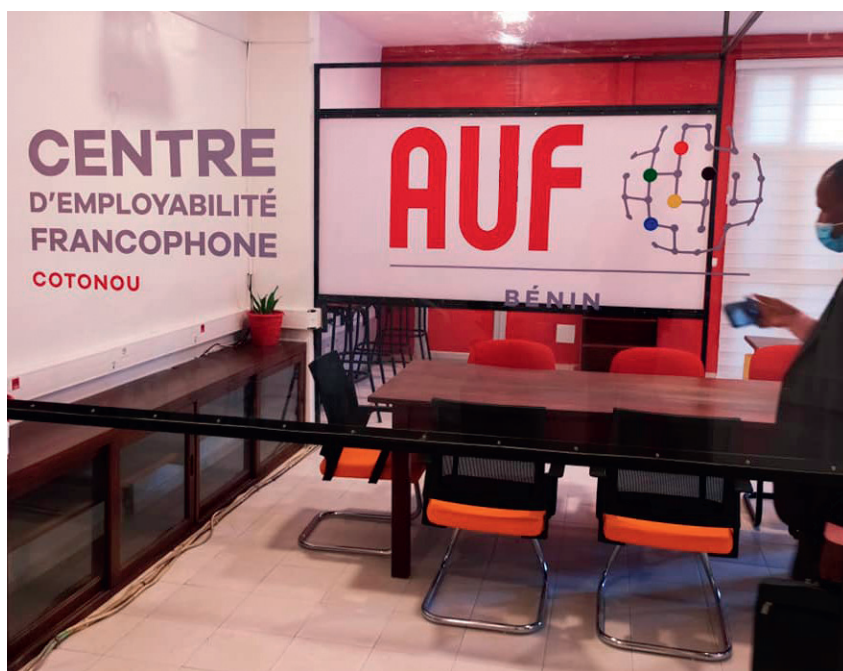
CEF Cotonou, Bénin