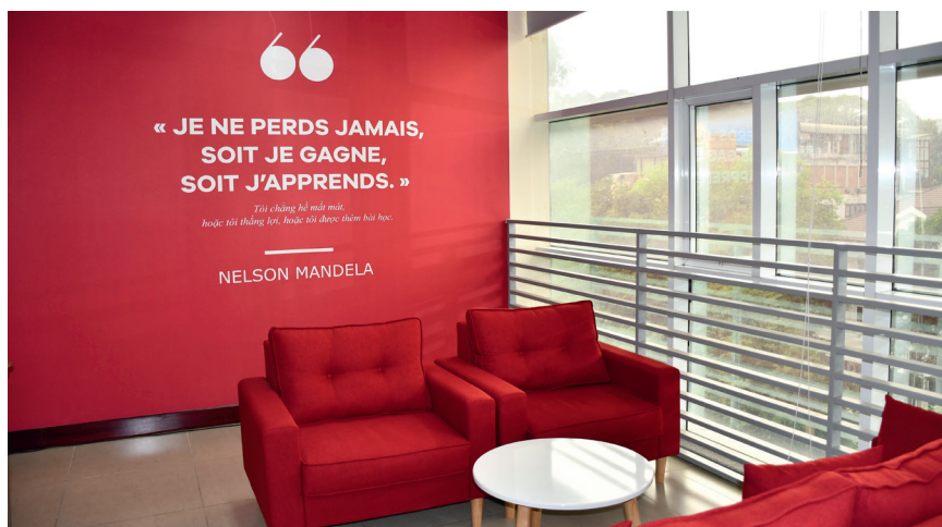
CEF Hồ Chí Minh-Ville, Vietnam

Une plateforme mondiale intégrée et collaborative reliera l'ensemble des CEF entre eux et avec les autres espaces de services de l'AUF afin d'enrichir l'offre de formation présentielle par des formations à distance partagées et de favoriser les partages d'évènements et de bonnes pratiques.