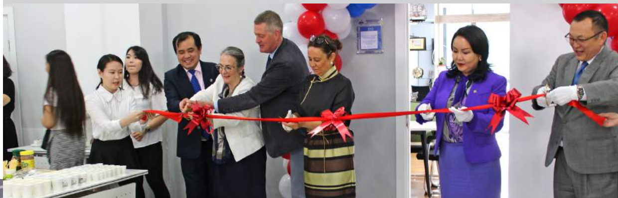
La cérémonie d'inauguration de l'Espace francophone d'innovation et de partenariat de Mongolie a rassemblé de nombreuses personnalités issues des mondes universitaires, politique et des corps diplomatiques.

L'Université nationale de Mongolie a inauguré son Espace francophone d'innovation et de partenariat le 8 juin 2018. Cet espace, mis en place en partenariat avec l'AUF, est dédié à la recherche et à l'enseignement supérieur francophone. L'établissement est désormais relié au réseau des 11 autres campus et espaces numériques francophones et CNEUF de la région Asie-Pacifique (au Vietnam, au Laos, au Vanuatu, en Chine et en Thaïlande), participant ainsi à ce vaste réseau de compétences et d'expertise au service de la connaissance, de la formation et de l'innovation dans les méthodes d'enseignement et de recherche.