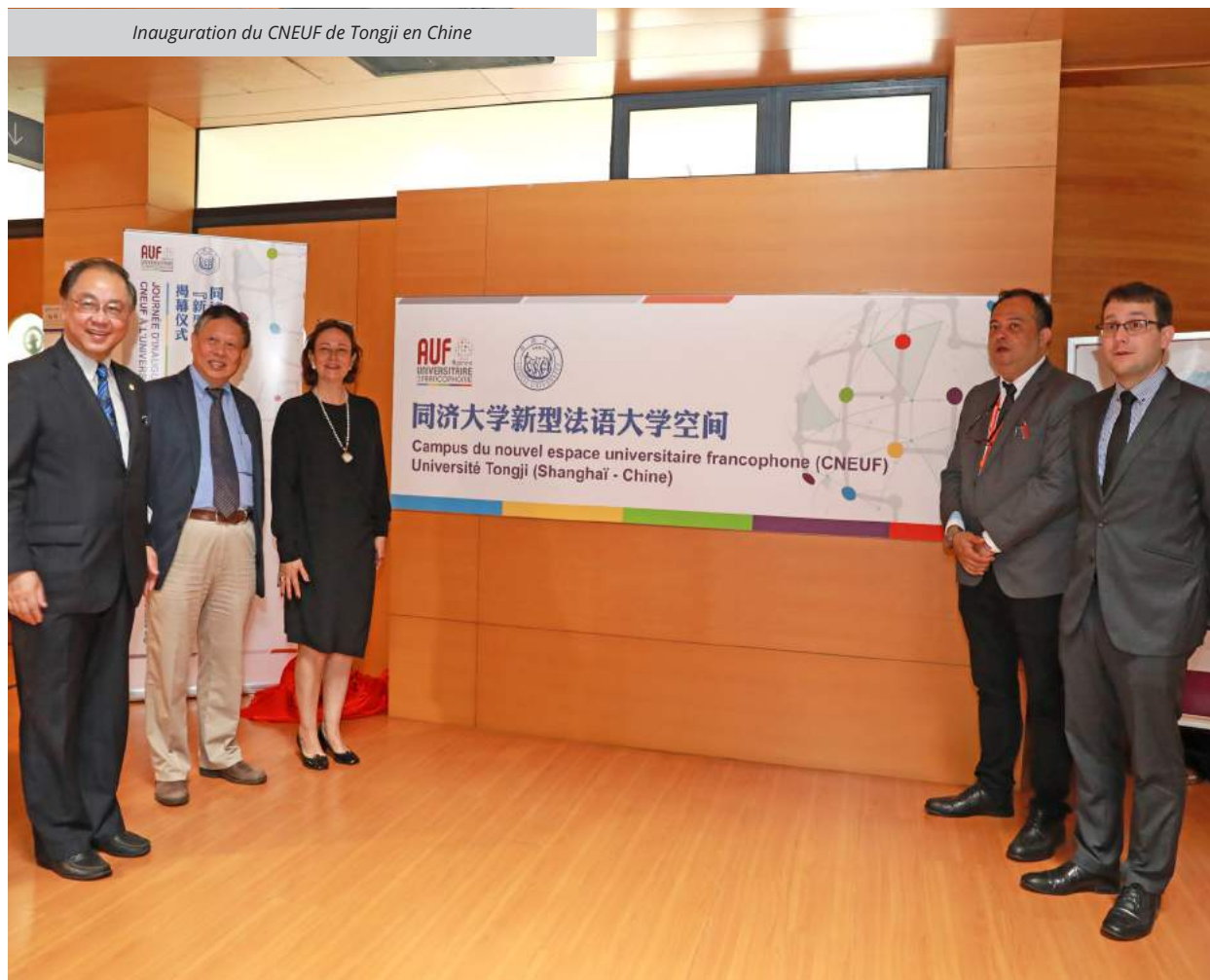
Inauguration du CNEUF de Tongji en Chine

Cette stratégie nécessite enfin la mise en réseau d'espaces et d'outils dédiés à l'entrepreneuriat et à la pré-incubation. C'est notamment le sens de la création d'une nouvelle génération de campus numérique par l'AUF : les CNEUF (Campus du nouvel espace universitaire francophone).