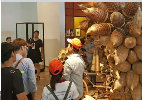
Etudiants cambodgiens et laotiens visitent le Musée d'Ethnographie du Vietnam pendant l'Université d'été des étudiants 2018 organisé par l'Université de Hanoi (Vietnam) avec le soutien de l'AUF.