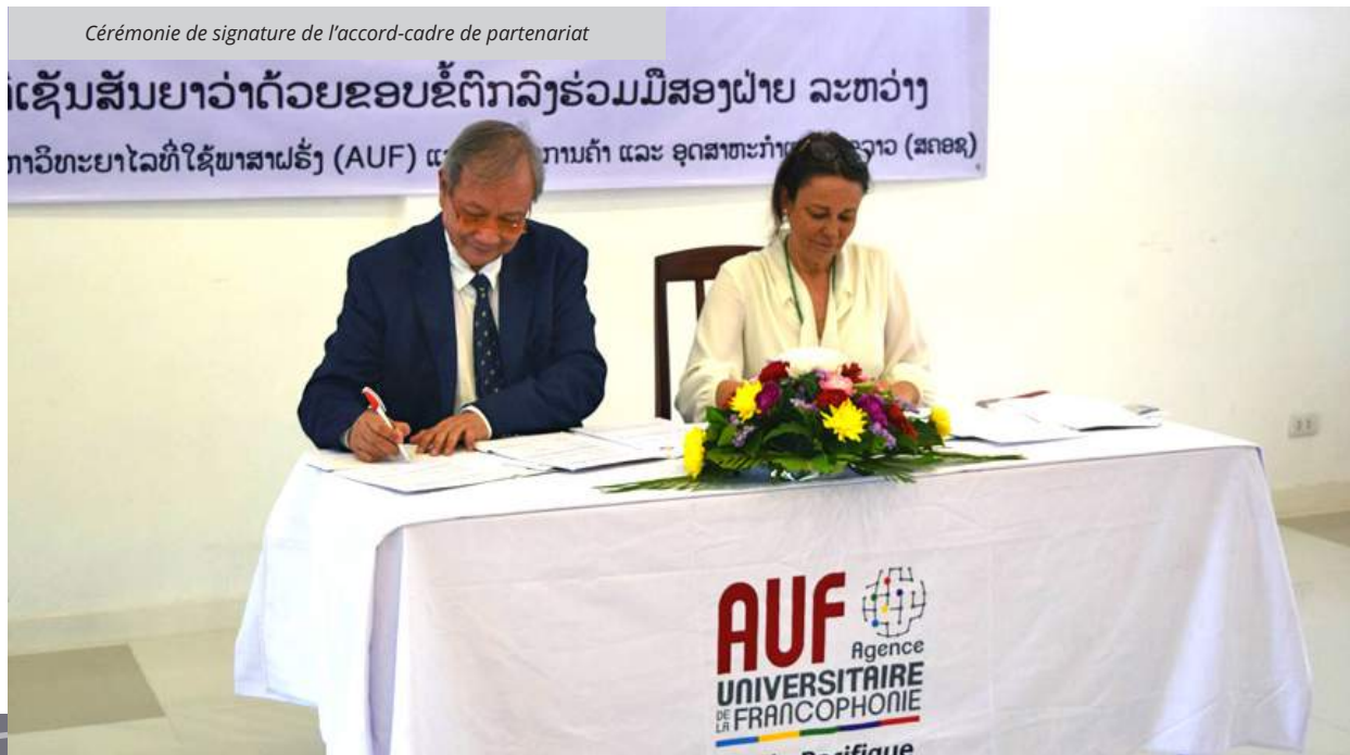
Cérémonie de signature de l'accord-cadre de partenariat

L'AUF et la Chambre nationale de commerce et d'industrie du Laos (LNCCI) ont signé un accord-cadre de partenariat le 24 mai 2018 à l'Antenne AUF de Vientiane. Les parties s'engagent ainsi à mener une action conjointe en vue de renforcer la visibilité et la présence de leur membres et de leur expertise dans le contexte du marché économique local et régional.