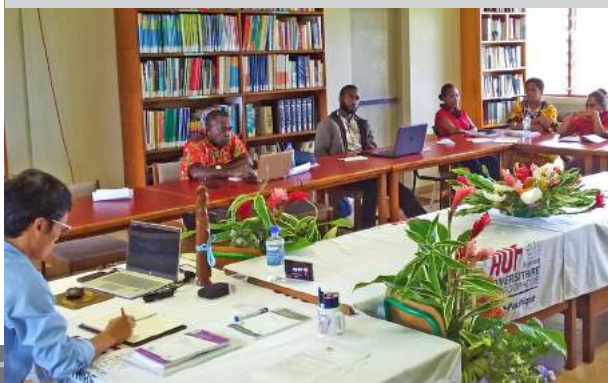
Participants à l'atelier sur la formation hybride au Vanuatu en septembre 2018

Une vingtaine d'enseignants et décideurs des universités vietnamiennes ont participé à deux ateliers de contextualisation du « Guide d'accompagnement des formations hybrides » organisés par la direction Asie-Pacifique de l'AUF à l'Université d'économie et de droit de l'Université nationale du Vietnam à Hô Chi Minh-Ville et à l'Université de Nha Trang (Vietnam) du 5 au 10 mars 2018. Ce type d'atelier a aussi été organisé à l'Antenne du Pacifique de l'AUF à Port-Vila (Vanuatu) du 18 au 20 septembre 2018 en vue de favoriser le déploiement du numérique éducatif dans l'enseignement supérieur au Vanuatu.