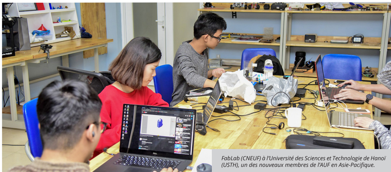
FabLab (CNEUF) à l'Université des Sciences et Technologie de Hanoi (USTH), un des nouveaux membres de l'AUF en Asie-Pacifique.