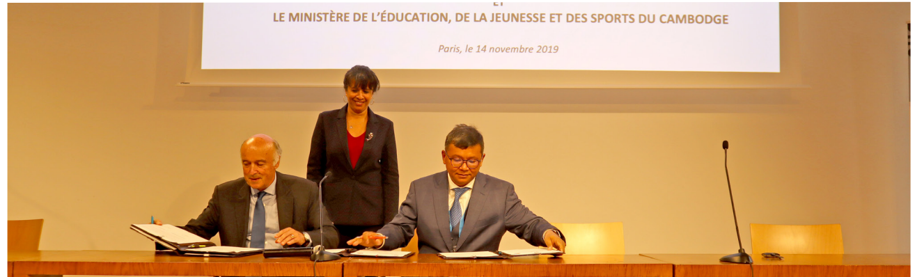
Cet accord permettra de renforcer la coopération entre le MEJS et l'AUF, au profit du développement de l'enseignement supérieur et de la recherche au Cambodge.

L'accord-cadre entre l'AUF et le Ministère de l'Éducation et de la Formation du Vietnam : signé le 5 novembre 2019 à Hanoï, Vietnam.