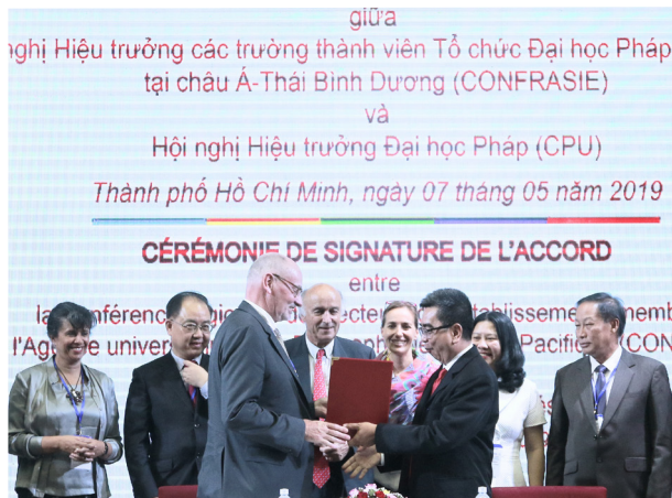
Cérémonie de signature de l'accord-cadre entre les représentants de la Conférence des présidents d'université (CPU) et la CONFRASIE.

La Conférence des présidents d'université (CPU) et la Conférence régionale des recteurs des universités membres de l'Agence universitaire de la Francophonie en Asie-Pacifique (CONFRASIE) ont signé un accord-cadre à la fin de la 13e AG de la CONFRASIE tenue à Ho Chi Minh-Ville le 7 mai 2019. L'objectif est d'établir entre les parties une plate-forme permanente visant à structurer et développer le dialogue entre leurs membres, afin de favoriser les actions conjointes en matière de gouvernance universitaire, d'offre de formation, de structuration de la recherche, de l'innovation, de l'internationalisation des systèmes nationaux de l'éducation supérieure.