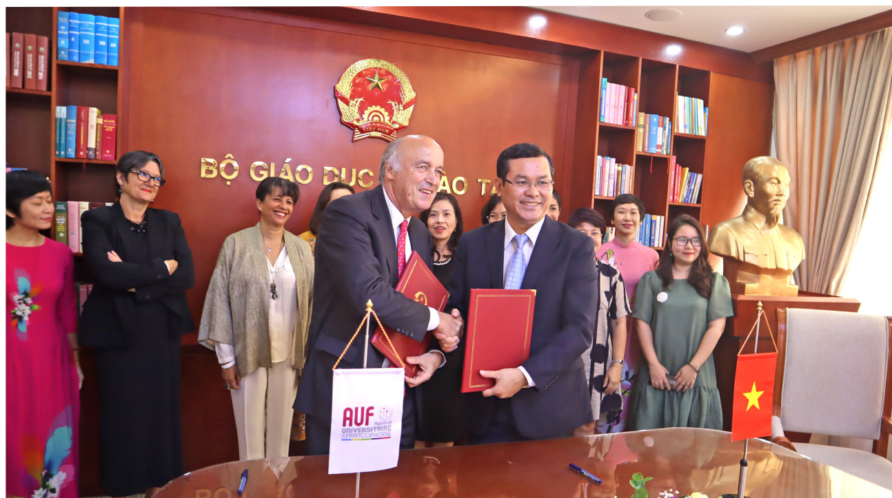
Ce premier accord - cadre entre l'AUF et le Ministère de l'Éducation et de la Formation du Vietnam concrétise les 25 ans d'engagement de l'AUF dans la région, qui compte aujourd'hui 40 établissements d'enseignement supérieur et de recherche membres au Vietnam.

d'évolution de l'enseignement supérieur et de la recherche dans la région. Plusieurs accords-cadres de partenariats ont été ainsi signés entre l'AUF et ses partenaires stratégiques dans la région. L'objectif de ces accords est de consolider et de renforcer les actions de coopération communes au service du développement de la francophonie universitaire au sein de la région Asie-Pacifique.