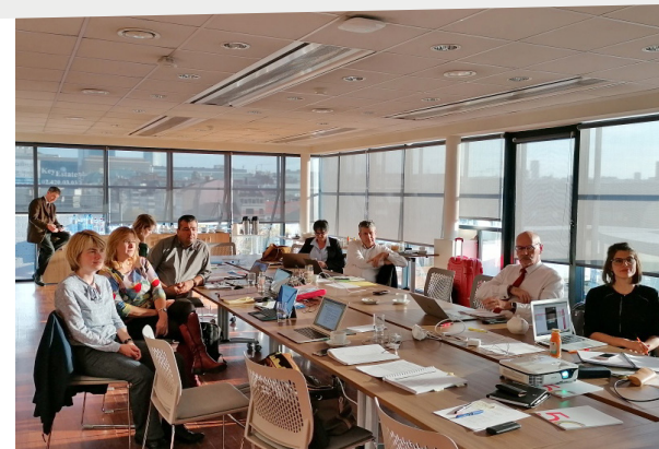
La réunion du bureau exécutif élargi du projet PURSEA, Bruxelles, les 21 et 22 novembre 2019.

Étant co-coordonnateur du projet avec l'Université de Hanoï, la Direction régionale Asie-Pacifique, en étroite collaboration avec la Direction régionale de l'Europe de l'Ouest de l'AUF, est chargée de la gestion administrative et financière du projet avec