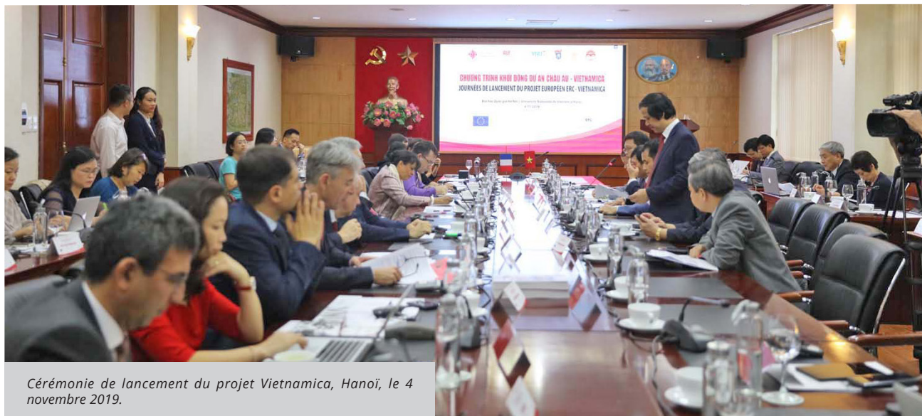
Cérémonie de lancement du projet Vietnamica, Hanoï, le 4 novembre 2019.

L'AUF en Asie-Pacifique, partenaire à part entière de ce projet en assure la gestion administrative et financière au Vietnam.