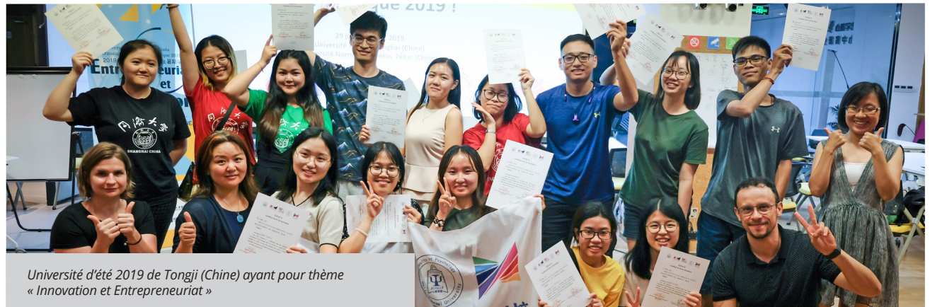
Université d'été 2019 de Tongji (Chine) ayant pour thème « Innovation et Entrepreneuriat »

Pendant 6 jours, les étudiants ont assisté à des conférences thématiques, visité des sites touristiques majeurs de Luang Prabang et rencontré des professionnels francophones issus des secteurs de l'hôtellerie et des métiers de guide.