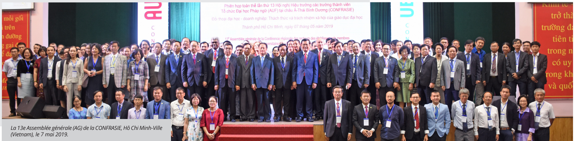
La 13e Assemblée générale (AG) de la CONFRASIE, Hô Chi Minh-Ville (Vietnam), le 7 mai 2019.

Par délégation du Conseil scientifique de l'AUF, la Commission régionale des experts est un organe qui participe à la définition et à la cohérence des orientations stratégiques de la politique scientifique régionale dont l'élaboration et la mise en œuvre, tant fonctionnelles qu'opérationnelles, relèvent de la direction Asie-Pacifique de l'AUF. La CRE participe au dispositif d'évaluation qui accompagne la politique scientifique régionale, notamment à travers des recommandations sur l'évaluation des projets.