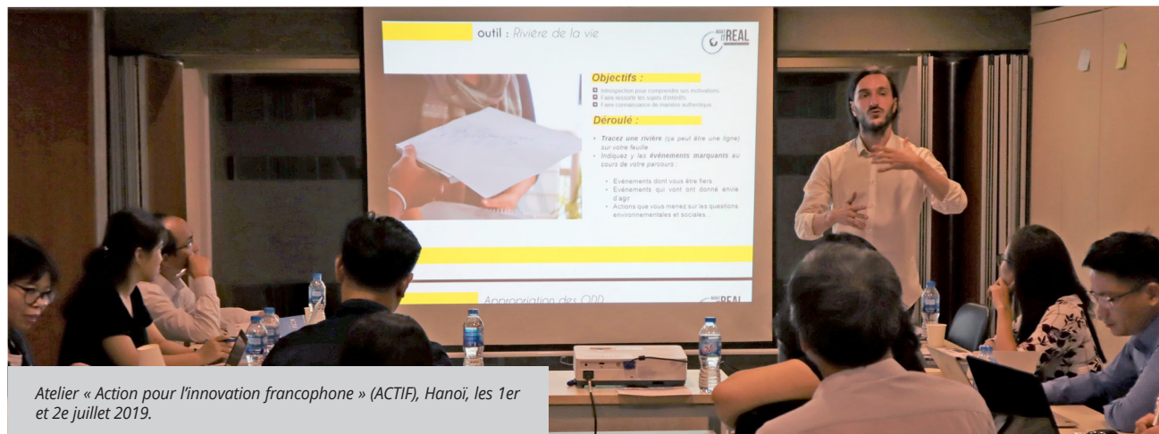
Atelier « Action pour l'innovation francophone » (ACTIF), Hanoï, les 1er et 2e juillet 2019.

Le projet COCLICAN « Consortium collaboratif pour la détection précoce du cancer du foie » porté par l'Institut de Recherche pour le Développement, avec un financement de 450.000€ de l'Union Européenne a pour objectif de former les professionnels de santé à l'anatomopathologie, aux techniques de génotypage et à l'échographie. Grâce au soutien de l'AUF, l'Université des Sciences de la Santé du Laos a renforcé et étendu les activités du projet à l'Université des Sciences de la Santé du Cambodge, permettant ainsi de consolider le réseau d'appui des praticiens dans le diagnostic de la maladie et de construire la cartographie des souches circulant dans les deux pays afin d'affiner la prise en charge thérapeutique.