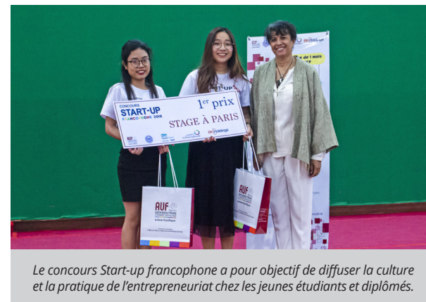
Le concours Start-up francophone a pour objectif de diffuser la culture et la pratique de l'entrepreneuriat chez les jeunes étudiants et diplômés.