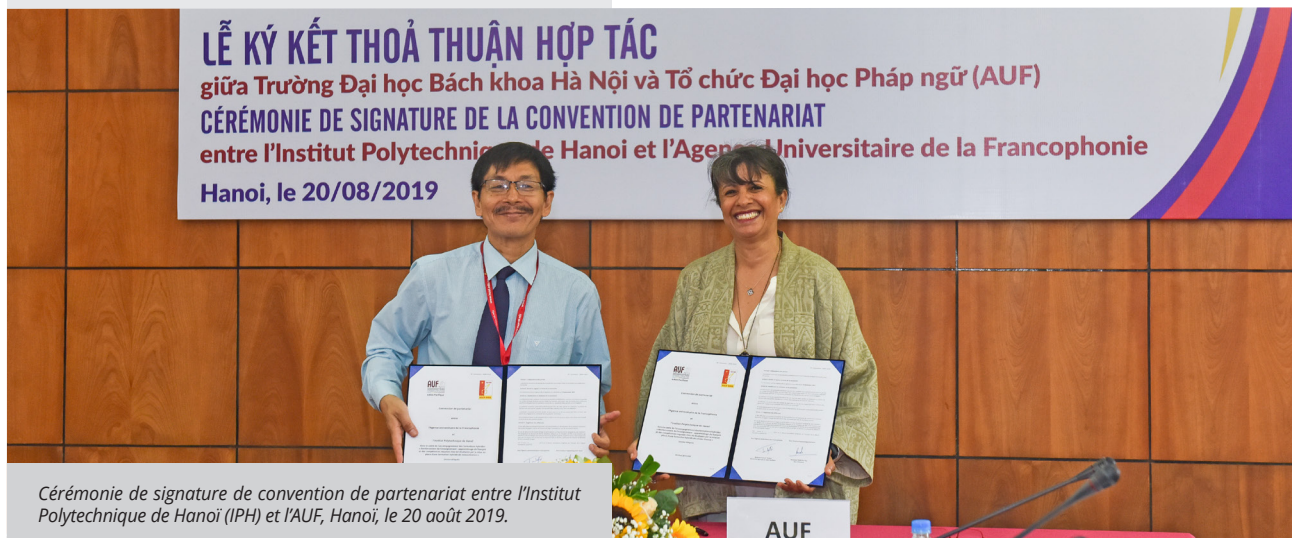
Cérémonie de signature de convention de partenariat entre l'Institut Polytechnique de Hanoi (IPH) et l'AUF, Hanoi, le 20 août 2019.

Inauguré en mai 2019, le CNEUF de l'Institut de Technologie du Cambodge (ITC) est le troisième CNEUF développé dans la région avec l'accompagnement de l'AUF, après celui de l'Université des Sciences et Technologie de Hanoi (USTH) inauguré en 2017 et celui de l'Université Tongji (Chine) inauguré en 2018.