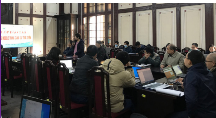
Ateliers E-formation à destination des enseignants de l'Université de Pharmacie de Hanoi (Vietnam), partenaire du projet.

Soutenu par la Fondation Pierre Fabre, le Réseau Mékong Pharma vient à la suite du programme Master Mékong Pharma. Démarré en 2020 pour une durée de 5 ans, ce réseau contribue à l'échange de connaissances en sciences pharmaceutiques au profit des enseignants des quatre universités d'Asie du Sud-Est initialement partenaires dans le Master Mékong Pharma (Université de Pharmacie d'Hanoi, Université de Pharmacie et de Médecine de HCMV, Université des Sciences de la Santé du Cambodge et Université des Sciences de la Santé du Laos). Ceux-ci pourront à leur tour former de futurs pharmaciens au meilleur niveau pour qu'ils puissent, dans les institutions publiques ou privées où ils travailleront, garantir la qualité du médicament. Avec la contribution des experts scientifiques du monde académique et de l'industrie, seront organisés des séminaires spécialisés adaptés aux besoins des enseignants et des universités dans des disciplines pharmaceutiques prioritaires pour les pays concernés, en fonction des enjeux de santé publique.