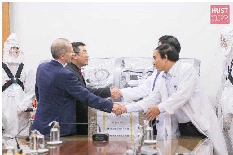
Cérémonie de remise des premières civières médicales de l'Institut Polytechnique de Hanoi à l'hôpital Bach Mai et à l'hôpital national des Maladies tropicales, le 14 octobre 2020 à Hanoi (Vietnam).

L'appel à projet vise à valoriser l'apport des universités membres de l'AUF au développement de solutions à impact technologique et/ou social immédiat pour aider les systèmes de santé et les populations à faire face aux difficultés provoquées par la pandémie du COVID-19. À travers cette action, l'AUF entend soutenir le développement d'initiatives innovantes et responsables, adaptées à leur écosystème et à impact immédiat.