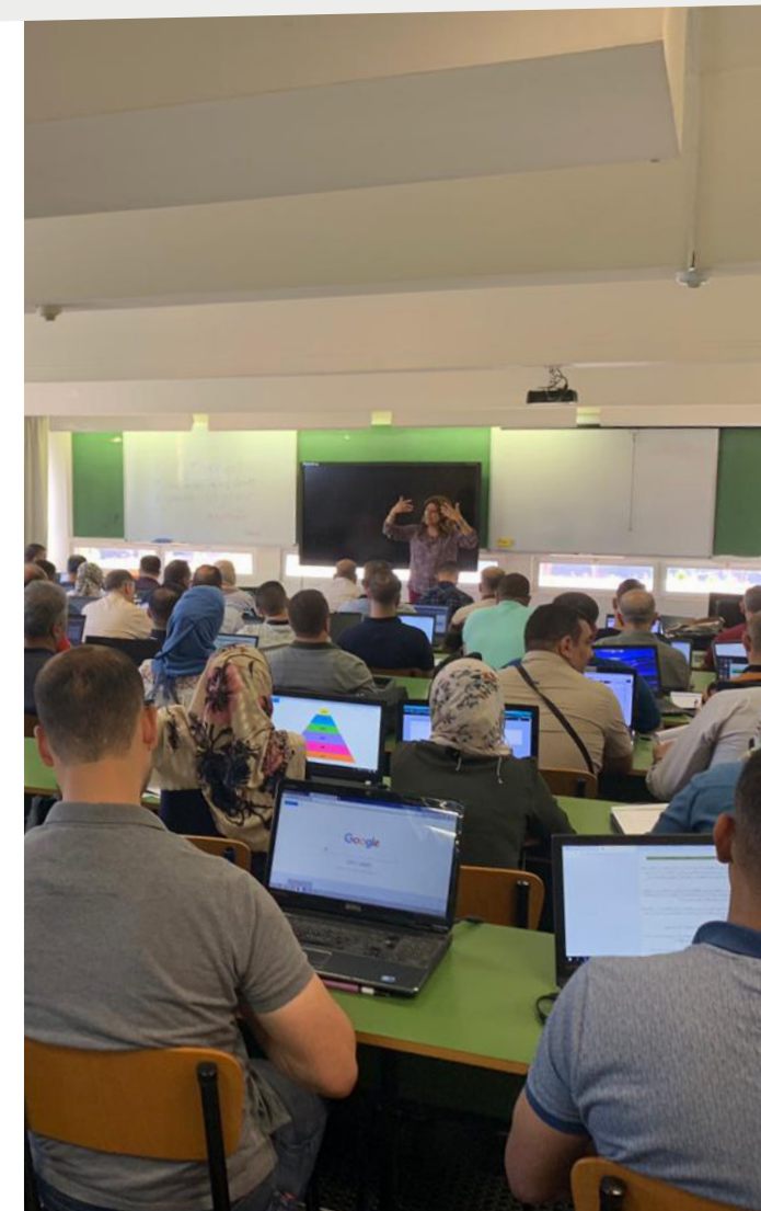
► Création d'un espace numérique d'apprentissage à l'université de Mossoul (Irak)