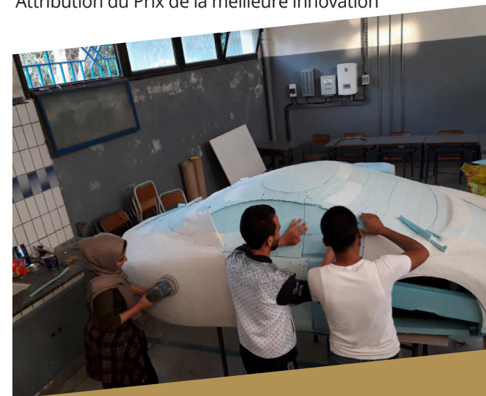
Green Lab, Fab Lab de la Faculté des Sciences et Techniques, Tanger .