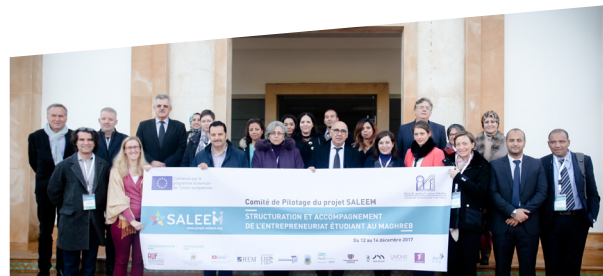
Rabat, décembre 2017 - 1er comité de pilotage du projet SALEEM Co-financé par le programme Erasmus+ de l'Union Européenne