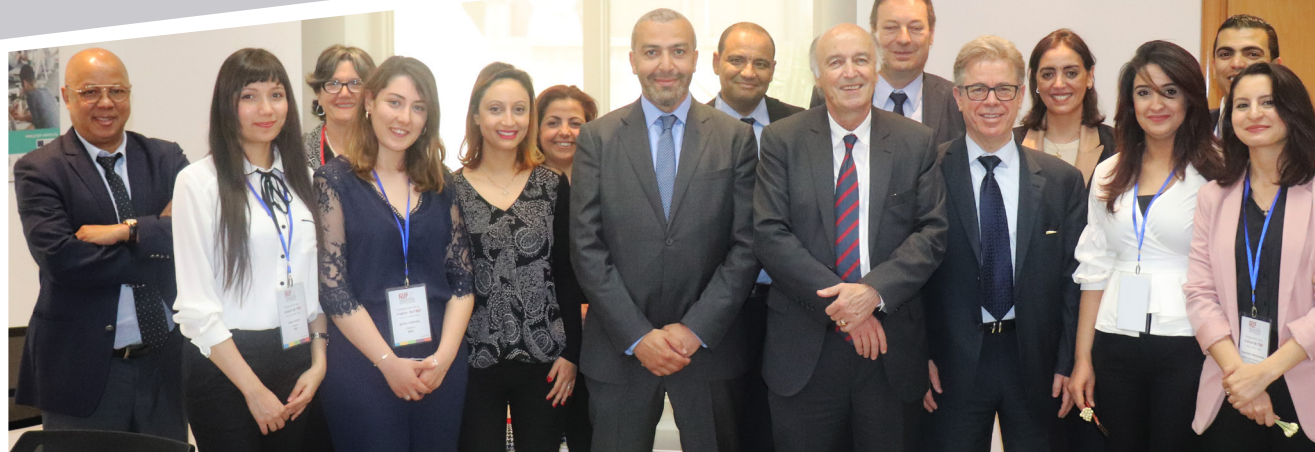
Avril 2018 - Promouvoir l'employabilité et l'insertion professionnelle des diplômés tunisiens - Signature d'une convention de partenariat avec Sofrecom - Tunisie

Le Maghreb revêt une importance toute particulière pour l'AUF : c'est une région très active par l'intensité et la profondeur des coopérations universitaires existant entre les deux rives de la mer Méditerranée, et qui représente également le point de passage obligé des échanges entre l'Europe et l'Afrique.