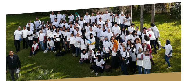
Fès, décembre 2018 - Concours «Challenge Projets d'entreprendre» : Près de 120 élèves ingénieurs de la Faculté des Sciences et Techniques de Fès (Maroc) sensibilisés à l'entrepreneuriat

«Challenge Projets d'Entreprendre» - Sur une semaine, 170 élèves-ingénieurs et étudiants managers doivent imaginer et réaliser le meilleur projet de création d'entreprise innovante portant sur un service et/ou un produit TIC. Ce concept a été introduit et mis en œuvre en novembre 2018 pour la première fois à la Faculté des Sciences et Techniques de Fès (Maroc), en partenariat avec l'École Sup'Com (Tunisie), avec le soutien de la Direction régionale de l'AUF au Maghreb.