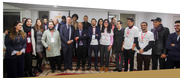
Rabat, décembre 2018 - Incubateur Francophone Maghrébin. 11 entrepreneurs (marocains et tunisiens) accompagnés.