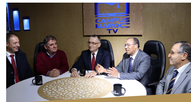
Studio de production de ressources pédagogiques installé au sein de la Faculté des Sciences de l'Éducation - Université Mohamed V de Rabat - Financement de l'AUF dans le cadre du projet UNIP.