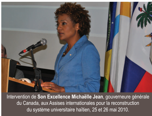
Intervention de Son Excellence Michaëlle Jean , gouverneure générale du Canada, aux Assises internationales pour la reconstruction du système universitaire haïtien, 25 et 26 mai 2010.

L'AUF offre son appui au renforcement ou à la création de structures nationales régissant l'enseignement supérieur et la recherche, ainsi qu'à la création d'une conférence de recteurs haïtiens. Cet appui pourra se réaliser sous forme de missions d'experts et d'ateliers et réunions, à la demande des acteurs haïtiens. L'Agence a également le projet de construire une plateforme collaborative facilitant échanges et collaborations entre les différents acteurs de l'enseignement supérieur et la recherche et comprenant des cartographies des institutions et des diplômes délivrés ainsi qu'une base de données sur le système universitaire.