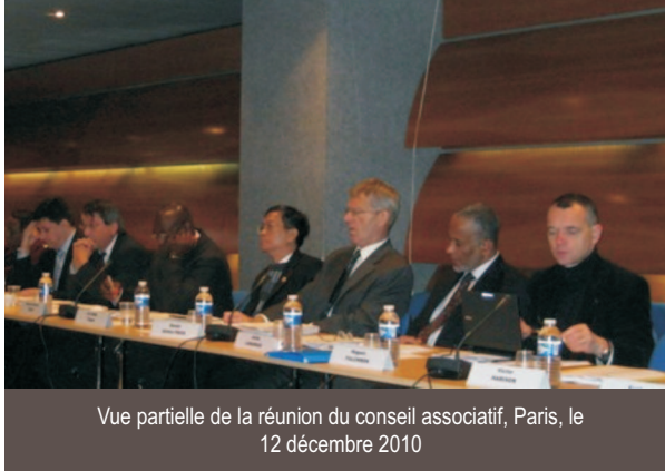
Vue partielle de la réunion du conseil associatif, Paris, le 12 décembre 2010

Le conseil d'administration de mai 2010 a par ailleurs été l'occasion d'approuver les nominations de trois directeurs de bureaux régionaux de l'AUF :