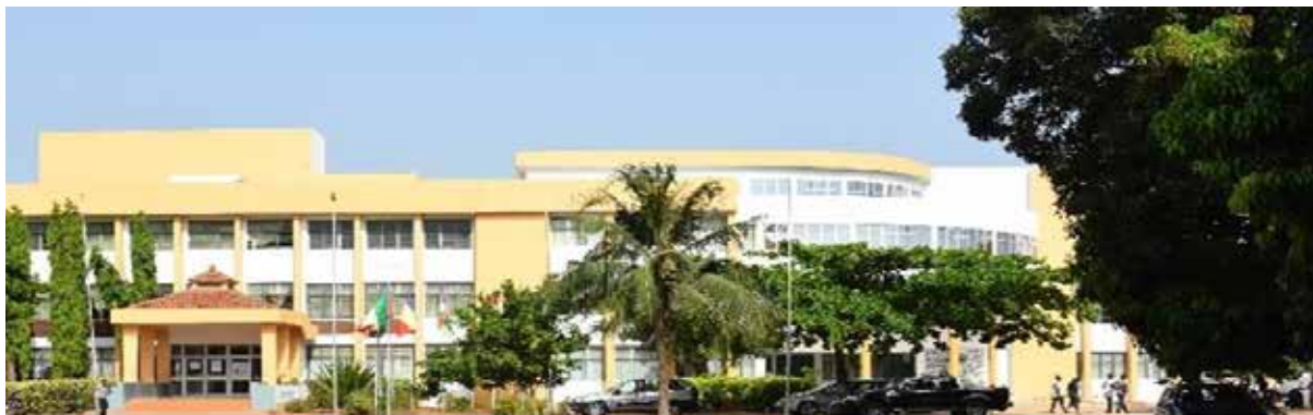
Ecole Africaine des Métiers de l'Architecture et de l'Urbanisme, 442 rue des balises BP 2067 Lomé-Togo