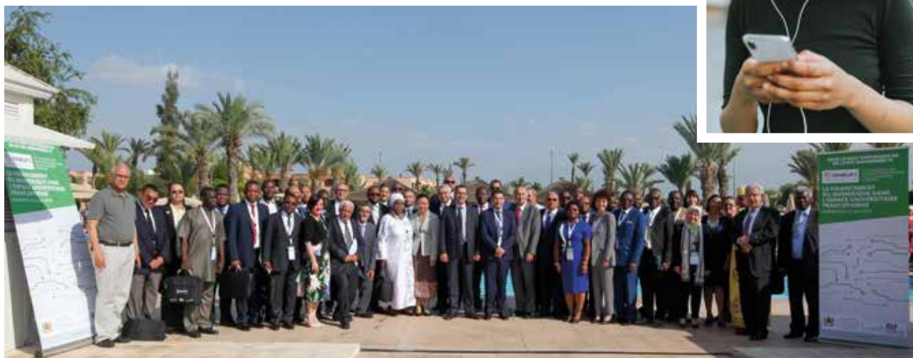
IDNEUF 3, Marrakech, Maroc, juin 2018

Depuis 2015, l'AUF et ses partenaires organisent annuellement la Conférence des ministres francophones de l'enseignement supérieur. Elle permet d'impulser une feuille de route commune pour développer le numérique dans l'espace universitaire francophone. Trois conférences ont été organisées (à Paris en 2015, à Bamako en 2016 et à Marrakech en 2018.). Un mandat de secrétariat permanent de la réunion des ministres a été confié à l'AUF.